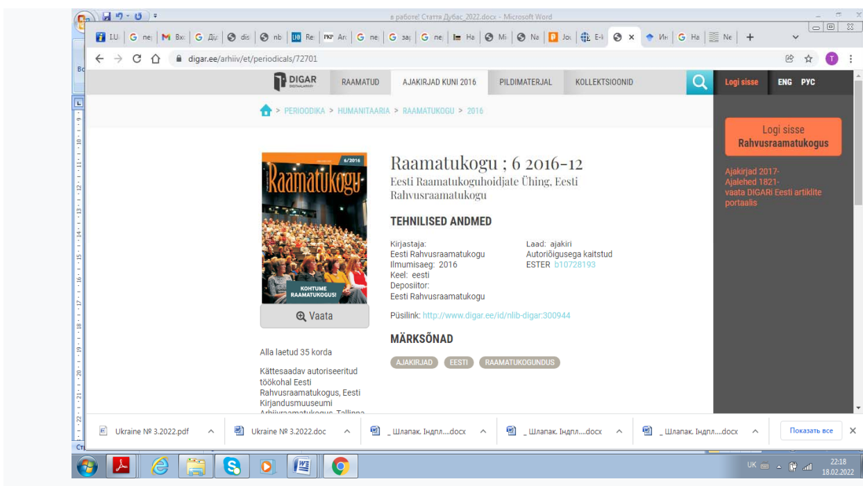
Рис. 4. Вебсторінка журналу Raamatukogu

Бібліотека готує у співпраці з Асоціацією бібліотекарів Естонії та видає журнал Raamatukogu («Бібліотека») – професійний журнал естонських бібліотекарів (рис. 4).