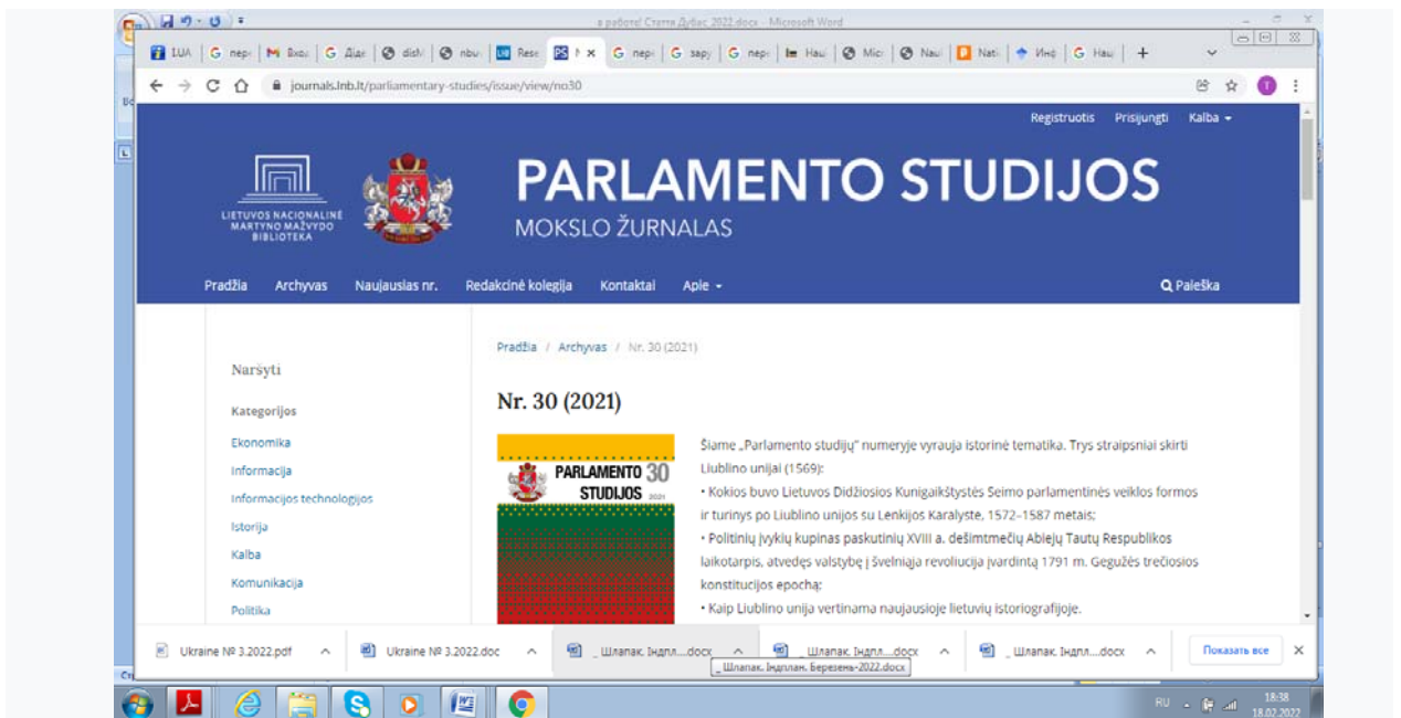
Рис. 1. Вебсторінка наукового журналу Parlamento studijos

Будучи парламентською бібліотекою з 1991 р., національна бібліотека пропонує дослідникам подавати тексти з найбільш актуальних питань, пов'язаних з політичними дослідженнями, законодавством (правом), економікою, риторикою та комунікацією. Це зміцнює поле парламентських досліджень, а також можливість для постійного відновлення дискусій з проблемних питань. Такі наукові публікації мають допомогти знайти відповіді як на національному, так і на міжнародному рівні на виклики та навіть погрози перед парламентською демократією. У журналі «Парламентські дослідження» публікуються статті, присвячені історичним, правовим і мовним традиціям національного та європейського парламентаризму й проявам суспільно-політичного життя. «Парламентські дослідження» – журнал відкритого доступу, основна увага в ньому приділяється статтям з політичних досліджень, історії, соціології, права, інформації, лінгвістики та інших соціальних і гуманітарних дисциплін, а також презентацій конференцій, навчальних матеріалів, публікацій джерел, опитування та оглядів, пов'язаних з парламентськими дослідженнями. Редколегія журналу дотримується рекомендацій Комітету з публікаційної етики (COPE), встановлених для редакторів, рецензентів та авторів. Затверджені редколегією журналу вимоги до авторів пропонуються в рубриці «Матеріали / Посібник для авторів».