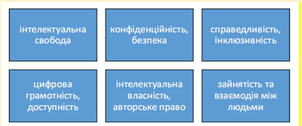
Рис. Етичні проблеми четвертого етапу впровадження ШІ у бібліотеках: ера розумних бібліотек (2025 – майбутнє)

ШІ має безцінний потенціал у доповненні нових підходів до процесу управління знаннями в бібліотеках, до їхньої організації, зберігання та інтеграції, що особливо важливо для освіти та науки. Бібліотеки можуть підтримувати етичні дослідження ШІ, адже низка етичних проблем, пов'язаних із дослідженнями та застосуванням ШІ, виникають через неповні, неправильні або упереджені дані. Бібліотекарі можуть застосовувати власний досвід у зберіганні, ліцензуванні, оцінці якості, безпечному та етичному їхньому зберіганні. Бібліотеки також можуть підтримувати етичні дослідження ШІ шляхом закупівлі технологій, які дотримуються етичних стандартів конфіденційності та інклюзивності [12].