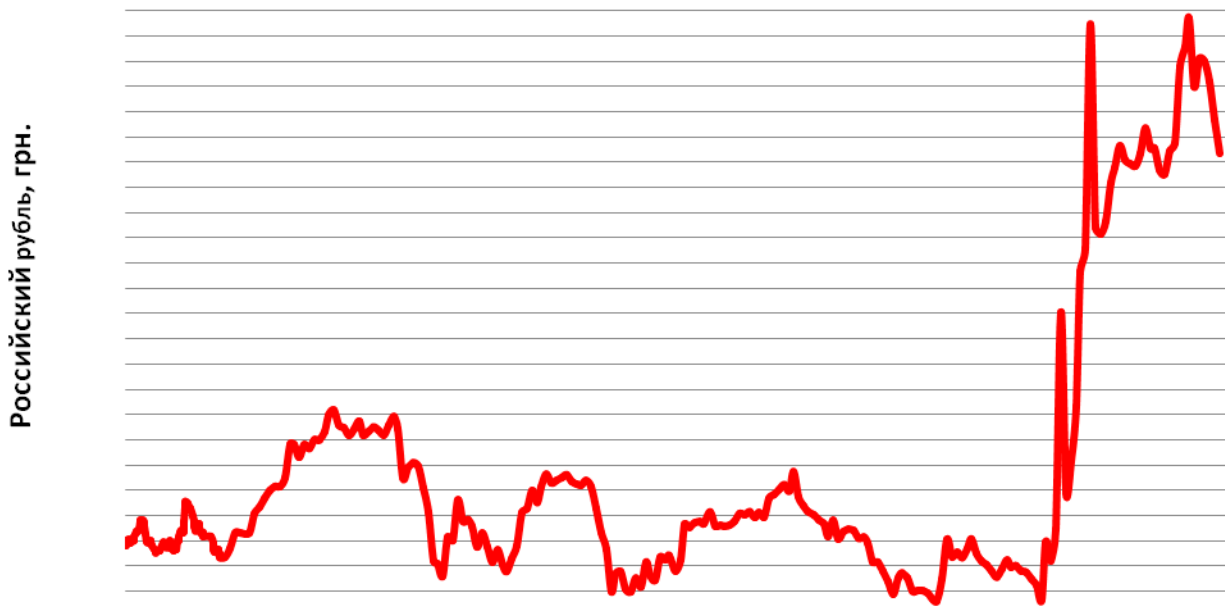
Средний курс продажи наличного российского рубля в Украине

Причин для укрепления российской валюты в Украине на неделе с 6 по 10 октября нет. Слабость рубля на международном рынке и отсутствие поддержки со стороны ЦБРФ предвещают дальнейшее падение валюты России. Не исключено, что некоторая коррекция вверх стоимости нефти марки Brent может способствовать и коррекции стоимости рубля против доллара США, но вряд ли это скажется схожей динамикой и на валютном рынке Украины. На текущий момент положение гривны будет более весомым, чем ситуация на внешних рынках. Средний курс продажи наличного рубля в этот период может колебаться в диапазоне 0,345–0,355 грн.