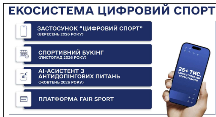
Джерело інформації: https://mms.gov.ua/storage/app/sites/16/News/2026/maibutnje-ukrainskogo-sportu.pdf

Усі ці зміни базуються на оновленому законодавстві та цифрових рішеннях, що супроводжують атлета на кожному етапі його кар'єри 4 .