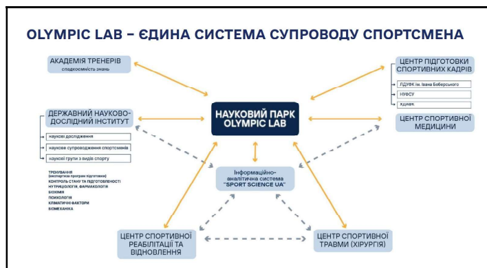
Джерело інформації: https://mms.gov.ua/storage/app/sites/16/News/2026/maibutnje-ukrainskogo-sportu.pdf

Спортивна інфраструктура. Важливим напрямом є відновлення спортивної інфраструктури, значна частина якої була пошкоджена внаслідок російської агресії. Міністерство пропонує створення мережі