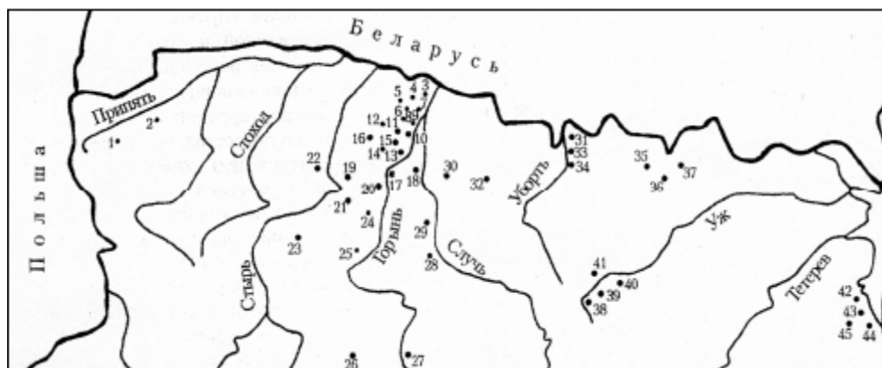
Рис. 1. Месторождения и проявления янтаря в Украинском Полесье (по Е. А. Солянику, 2002)

Цифры на карте: 1 – Владимировка, 2 – Александровка, 3 – Высоцк, 4 – Людынь, 5 – Лесовое, 6 – Ясинец, 7 – Лютинск, 8 – Мочулище-Черновое, 9 – Дубровица, 10 – Берестье, 11 – Нивецк, 12 – Трипутня, 13 – Бережница, 14 – Кидры, 15 – Осова, 16 – Владимирец, 17 – Цепцевичи, 18 – Сарны, 19 – Рафаловка, 20 – Городец, 21 – Иванчи, 22 – Великая Медвежка, 23 – Журавиче, 24 – Гута Степанская, 25 – Злазно, 26 – Старая Мошаница, 27 – Могиляны, 28 – Прислучье, 29 – Березно, 30 – Клесов, 31 – Копище, 32 – Рокитное, 33 – Майдан, 34 – Перга, 35 – Словечное, 36 – Збраньки, 37 – Овруч, 38 – Бараши, 39 – Викторовка, 40 – Ушомир, 41 – Гулянка, 42 – Межгорье, 43 – Новые Петровцы, 44 – Вышгород, 45 – Буча