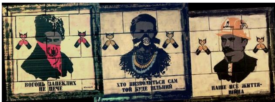
Рис. 4. #Sociopath Триптих «Ікони революції». Джерело: http://www.nr2.ru/kyiv/weekend/484770.html

Для кожного діяча #Sociopath також додав відповідне гасло, зокрема для Шевченка – «Вогонь запеклих не пече», Лесі Українки – «Хто визволиться сам, той буде вільний...», Франка – «Наше все життя – війна» (рис.4).