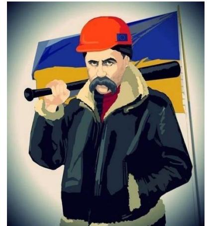
Рис. 7. Портрет Шевченка у касці і з битою.

У соціальних мережах активного поширення набули зображення Тараса Шевченка в будівельній касці, з шиною на плечі тощо, які за допомогою відповідних упізнаваних специфічних атрибутів – маска, каска, шина, бита – наближували образ Шевченка до протестувальників і навпаки (рис. 7, 8). Фактично на майдані Тарас Шевченко підтвердив свій статус народного поета України. Образ поета-побратима,