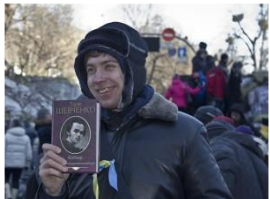
Рис. 2. Учасник Майдану.

Твори Тараса Шевченка, поряд з творами Василя Шкляра, Мирослава Дочинця, Григорія Сковороди, стали одними з найбільш запитуваних в бібліотеці Майдану, яку було відкрито в Українському домі (рис. 2). Про це кореспонденту видання «Gazeta.ua» розповіла одна з волонтерок, яка працювала в бібліотеці.