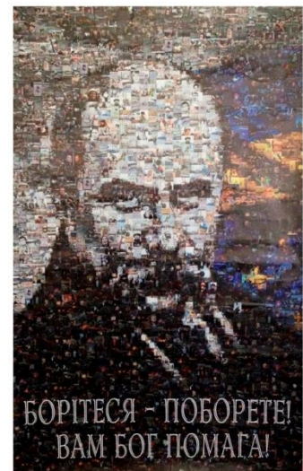
Рис. 10. Колаж із портретом Шевченка.