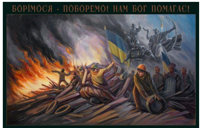
Рис. 9. О. Шупляк. «Борімося – поборемо. Нам Бог помагає!».

Виходячи з наведених прикладів, можна говорити про декілька різновидів сприйняття і відтворення образу Шевченка в творчості митців Майдану.