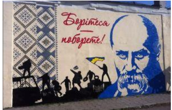
Рис. 5. Графіті із зображенням Шевченка в Кременчуці.

Напередодні 200-річчя Тараса Шевченка «майданівці» Кременчука на чолі з художником Сергієм Брілевим намалювали величезну графіті із зображенням Тараса Шевченка на тлі барикад на вул. Грушевського як подарунок Кобзарю (рис. 5). Місцем для художнього задуму вибрали стіну колишньої електро-станції.