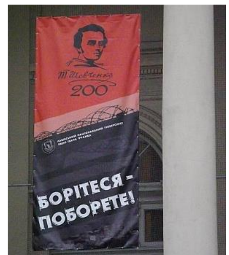
Рис.1 Прапор на фасаді Львівського національного університету ім. І. Франка

спинах протестувальників – повсюди біліють сотні прокламацій, звернень, лозунгів, гасел, епіграм, сатиричних малюнків, гумористичних звернень,