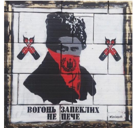
Рис. 3. Графіті із портретом Шевченка.

Графіті із зображенням поета української свободи прикрасили вулиці протестного Києва (рис.3). Столичний стрит-арт художник, який виступає під псевдонімом #Sociopath (соціопат. – Авт.), 10 лютого на барикадах вул.Грушевського розмістив триптих «Ікони революції» – півтораметрові зображення Тараса Шевченка, Лесі Українки й Івана Франка в стрит-арт інтерпретації, які, за задумом їх автора відповідно до його записів на сторінці у мережі Facebook