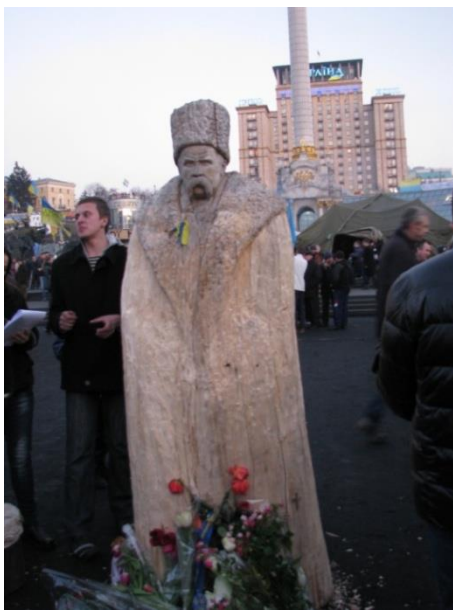
Рис. 6. Скульптура Кобзаря на Майдані Незалежності в Києві.

Над портретом Кобзаря молодь і художник працювали більше п'яти годин, після чого накрили його прапором України, а відкрили 9 березня 2014 року. Малюнок супроводжується цитатою з поеми Тараса Шевченка «Борітеся – поборете!» [14].