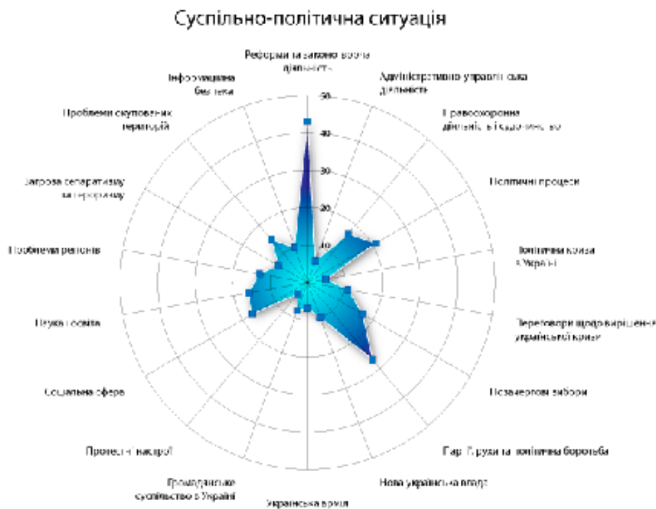
Рис. 3. Дані інфографічного звіту інформаційно-аналітичних підрозділів НБУВ

Зрештою, в Україні такі звіти, та й інші бібліотечні продукти в якості інфографіки вже починають представлятися на спеціальних конкурсах та виставках, де бібліотеки мають нагоду заявити не лише про свої нові досягнення, популяризувавши власний заклад, але й отримати додаткове фінансування на друк та поширення найкращих робіт.