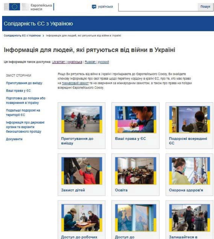
Рис. 2. Вебсторінка сайту Європейської Комісії «Солідарність ЄС з Україною».