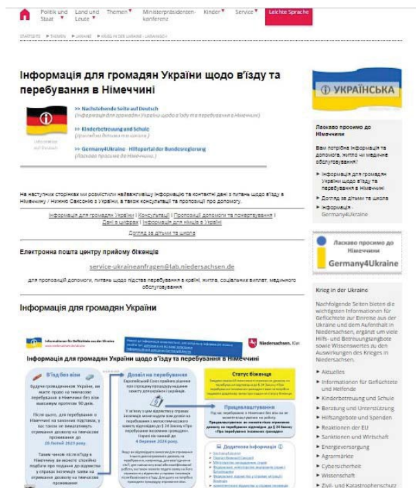
Рис. 4. Вебсторінка сайту уряду землі Нижня Саксонія ФРН «Інформація для громадян України».

На спеціально створених для українських біженців сайтах німецьких федеральних земель розміщуються файли з нагальними запитаннями та відповідями про в'їзд і перебування в Німеччині, через що біженцю простіше орієнтуватися у змінах нормативно-правової бази держави перебування і можливостях отримання різноманітної підтримки. Зокрема, на сторінці уряду землі Нижня Саксонія ФРН (URL: https://www.niedersachsen.de/ukraine ) розміщено найважливішу інформацію з питань щодо в'їзду в Німеччину (Нижню Саксонію), контактні відомості та можливості консультативної допомоги для українців (рис. 4).