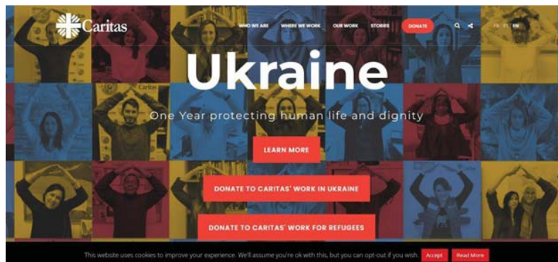
Рис. 5. Вебсторінка сайту Міжнародної конфедерації гуманітарної допомоги «Caritas Internationalis».

збільшили до 50 євро на сім'ю з трьох осіб. За потреби кожні 15 днів біженці можуть отримувати нову картку. Основною умовою є надання чеків, а розраховуватися цими картками можна лише у спеціальних двох супермаркетах, з якими Caritas має домовленість про реалізацію карток [6, с. 83].