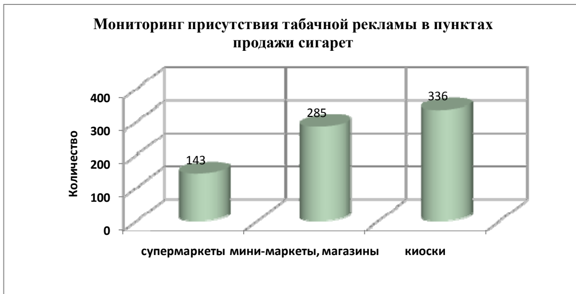
Рис. 1. Мониторинг присутствия табачной рекламы в пунктах продажи сигарет

в пунктах продажи сигарет в Киеве, Донецке, Одессе, Житомире, Симферополе, Львове, Черкассах, Чернигове, Виннице и Луганске. В целом, было проверено 764 пункта продажи – киоски, супермаркеты, магазины и мини-маркеты (рис. 1, 2).