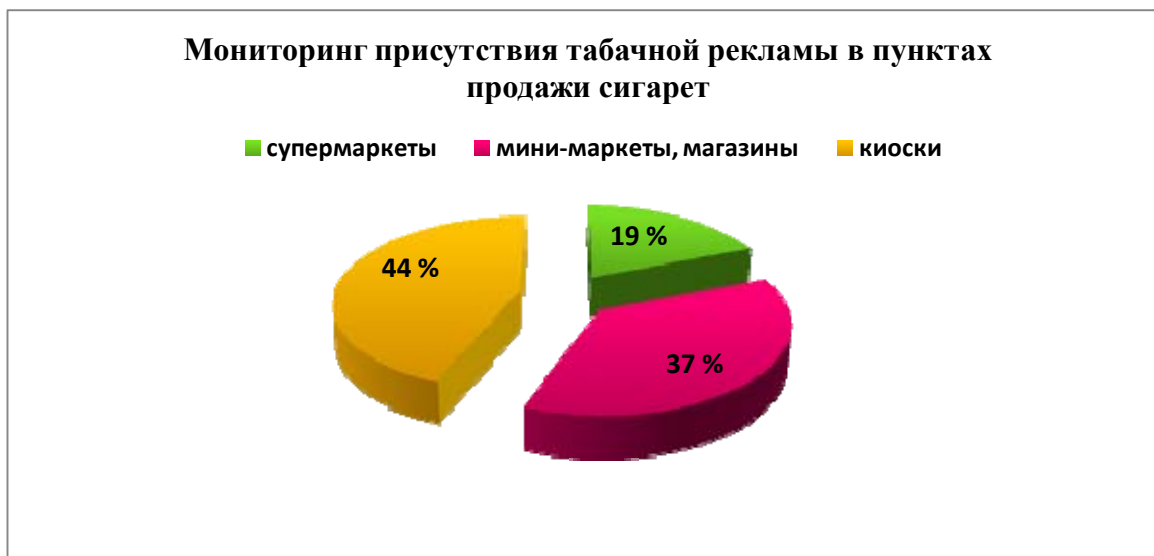
Рис. 2. Мониторинг присутствия табачной рекламы в пунктах продажи сигарет в процентном соотношении

По словам А. Скипальского, в 100 % заведений прямая реклама в пунктах продажи сигарет отсутствует. Однако, с его слов, продавцы начали привлекать внимание потребителей нетрадиционными способами (рис. 3). Так, 60 % торговых точек выкладывают пачки сигарет на светящихся витринах, 18 % – наклеивают