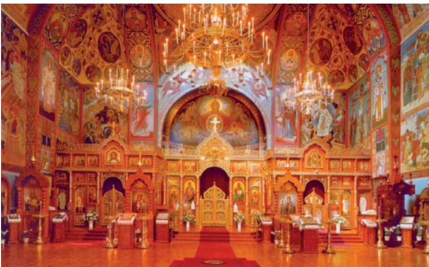
Кафедральный собор в наши дни

блаженный Иоанн, как и всякий человек, очень любил праздники, но только те, которые несут жизнь, а не смерть, те, которые доставляют истинную радость, а не сомнительные удовольствия. Однажды владыка пришел на хелунский бал, где принято рядиться в костюмы ведьм, духов, как бы вызывая темные силы. Это происходило, к тому же, накануне большого церковного праздника, и после службы владыка Иоанн приехал на маскарад – к величайшему изумлению участников. Музыка прекратилась, владыка в полном молчании пристально посмотрел на онемевших людей и стал неспешно обходить зал с посохом в руке. Он не произнес ни слова, да в том и не было нужды: один взгляд уязвил совесть каждого, вызвав всеобщее оцепенение... Блаженный Иоанн жил не буквой, которая убивает, а духом, который животворит. Как в Китае, так и в Западной Европе люди постепенно привыкли к тому, что владыка всегда мог преподнести неожиданность. Однажды, когда архиепископу Иоанну довелось быть в Марселе, он решил отслужить панихиду на месте жестокого убийства сербского короля