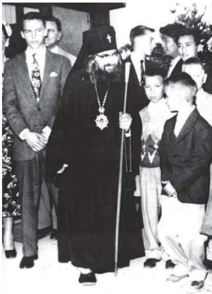
Во время строительства Кафедрального собора в честь иконы Божией Матери «Всех Скорбящих Радости». Сан-Франциско. 1960-е годы (из книги: Шоломова Софья. В кругу имен, в кругу времен (о роде Максимовичей) / Софья Шоломова. – X, 2011)

В 1951 году состоялось назначение архиепископа Иоанна на Западно-Европейскую кафедру. Здесь продолжают подвиги и архипастырство владыки. В Западной Европе владыка Иоанн проявил себя миротворцем в межконфессиональных дискуссиях, защитником французских и голландских верующих.