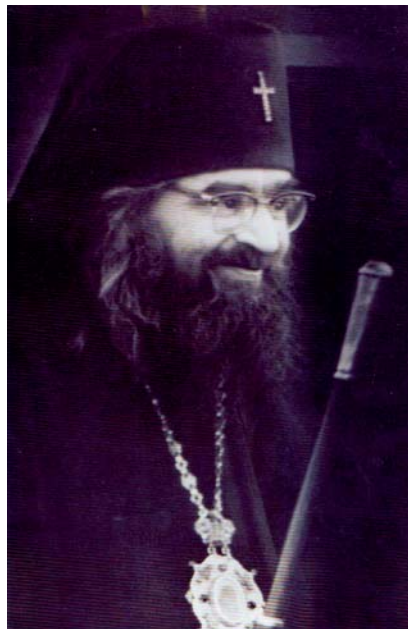
Святитель Иоанн Шанхайский и Сан-Францисский

ским уставом, с великолепными храмами, многолюдной братией (тогда было 600 человек) — оставил сильное впечатление на «молодом иноке с детства».