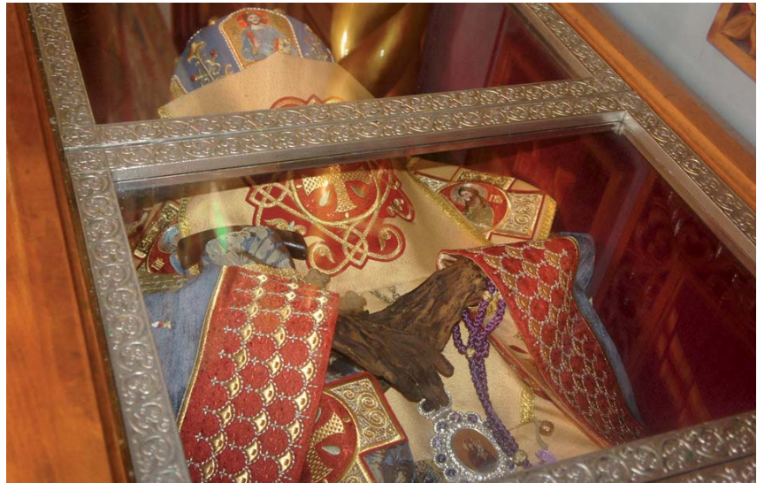
Святые мощи Святителя Иоанна Шанхайского и Сан-Францисского

сидел около пяти минут, затем встал, благословил меня и ушел. К тому времени у нашей входной двери уже стоял грузовик и работала группа полицейских. Тогда в Париже было много террористических актов, и этот предмет оказался бомбой».